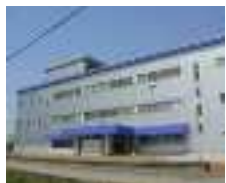
マイクロソリューション山形工場