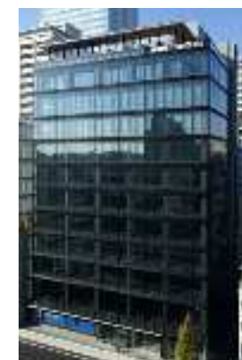
東京秋葉原新本社ビル外観