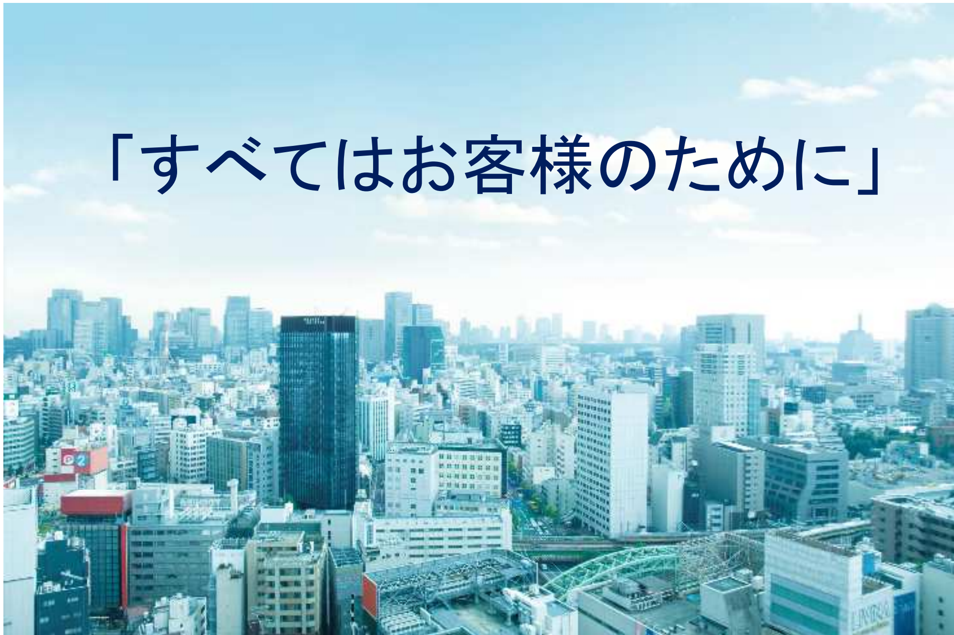
東京秋葉原の風景